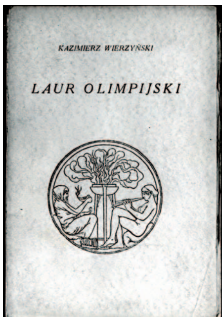
Kazimierz Wierzyński za tom wierszy „Laur olimpijski” zdobył złoty medal w Olimpijskim Konkursie Sztuki w Amsterdamie w 1928 roku