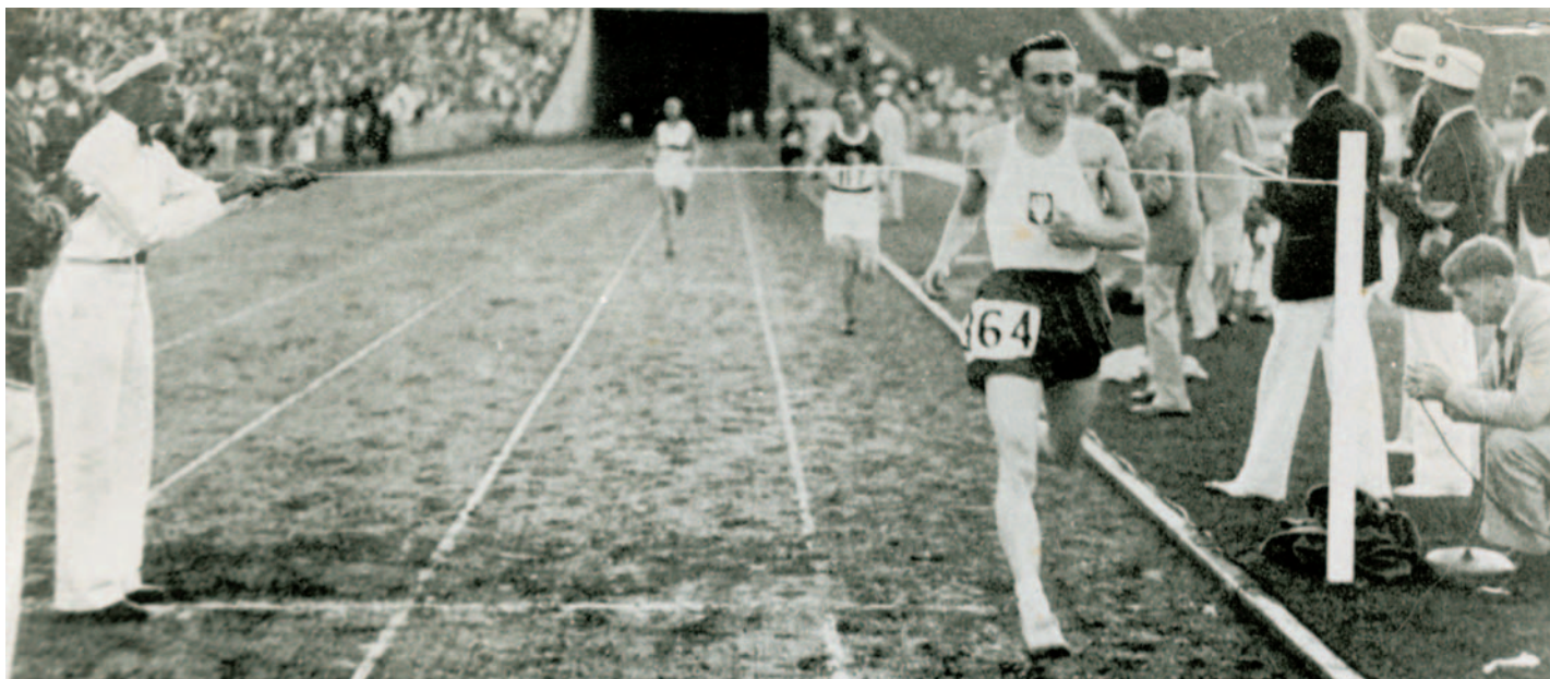
Pierwszy złoty medal w konkurencjach męskich wywalczył dla Polski Janusz Kusociński w Los Angeles w 1932 roku

Pierwszy złoty medal w konkurencjach męskich zdobył Janusz Kusociński, wygrywając w Los Angeles w 1932 r. w biegu na 10 000 m ze słynnymi, niepokonanymi dotąd biegaczami fińskimi ustanawiając rekord olimpijski na tym dystansie.