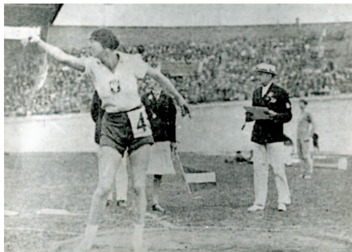
Pierwszy złoty medal dla Polski zdobyła Halina Konopacka w 1928 roku

Zdobywczynią pierwszego złotego medalu dla Polski była – na Igrzyskach XIX Olimpiady w Amsterdamie w 1928 r. – Halina Konopacka, która w rzucie dyskiem ustanowiła nowy rekord świata. Także w Amsterdamie Kazimierz Wierzyński zdobył pierwszy dla Polski złoty medal w olimpijskim konkursie sztuki za zbiór wierszy pt.: Laur olimpijski .