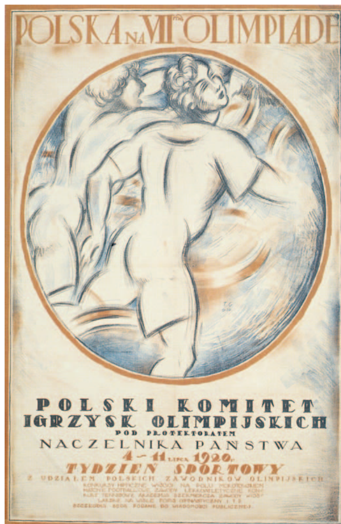
Plakat wydany z okazji Igrzysk VII Olimpiady w Antwerpii (1920)