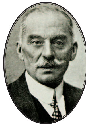
Książę Stefan Lubomirski pierwszy prezes PKOl